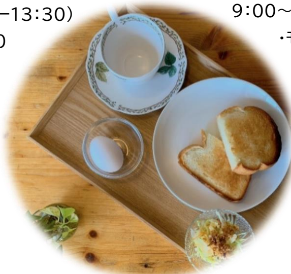
モーニングセット ¥350