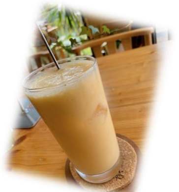
豆乳ミックスジュース ¥350