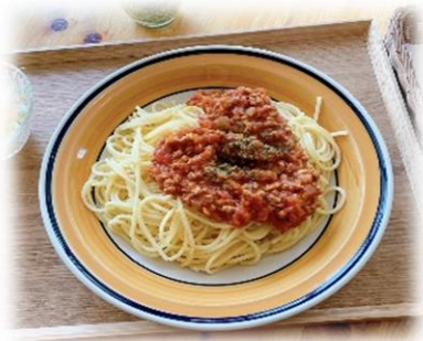
大豆ミートパスタ ¥650