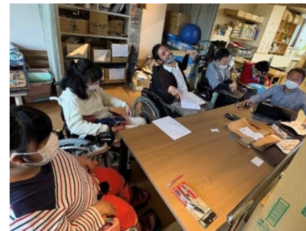
会議は楽しく真剣に！