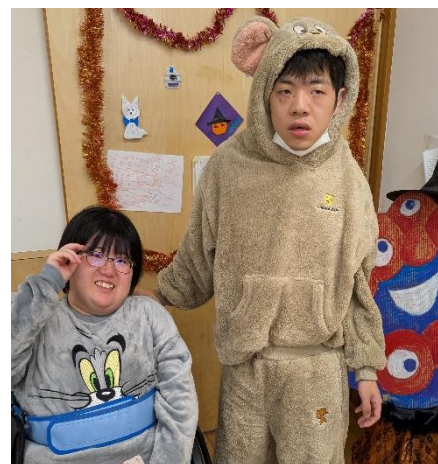
毎年恒例！みんなが楽しみにしてる「ハロウィン」もなかニコ会が企画してます