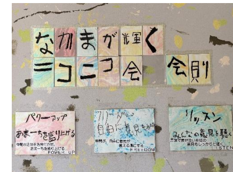
なかニコ会の会則はみんなの見える所に掲示しています。