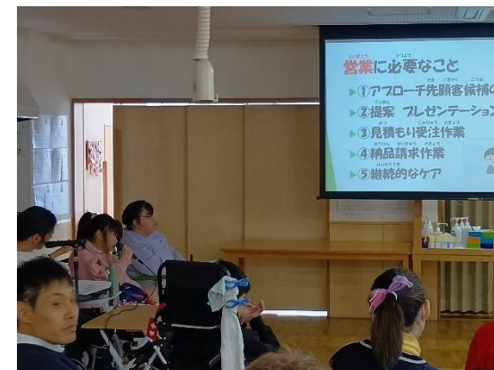
なかニコ会主催の学習会では「営業」についてみんなで学びました☆